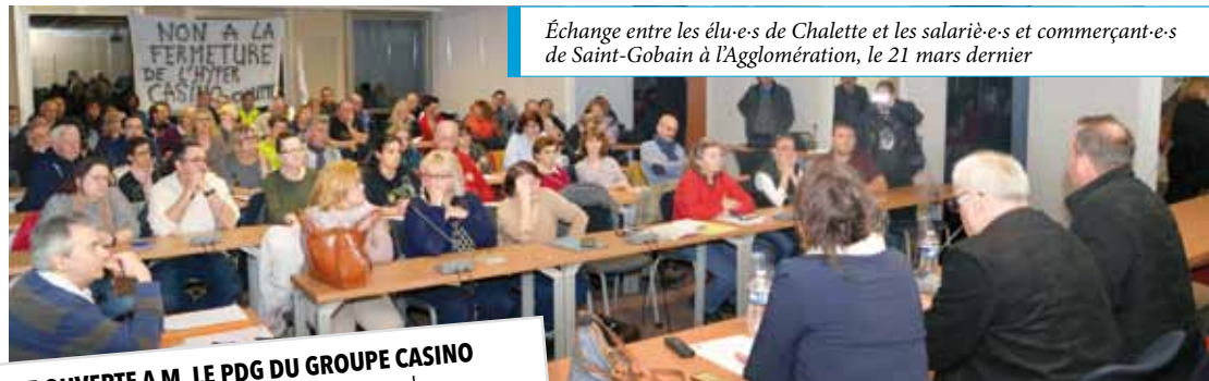
Échange entre les élu-e-s de Chalette et les salarié-e-s et commerçant-e-s de Saint-Gobain à l'Agglomération, le 21 mars dernier