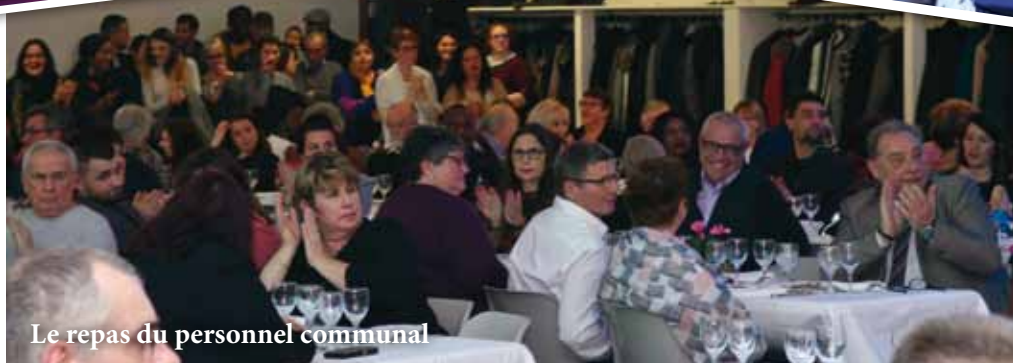
Le repas du personnel communal