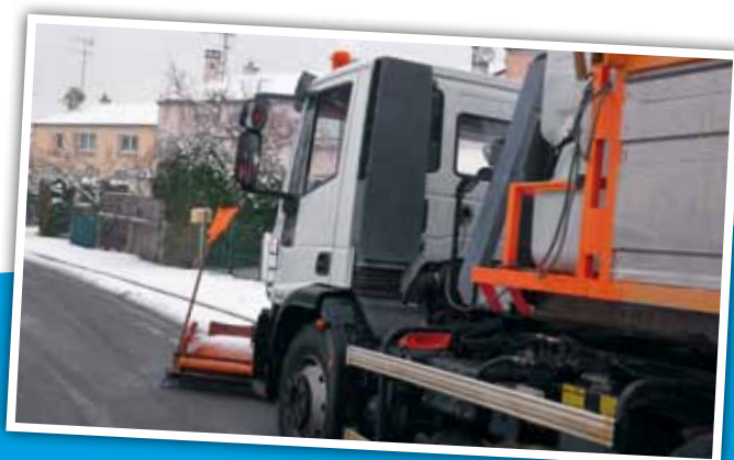
La déneigeuse des Services techniques en action le 22 janvier dernier

(1) Association sous tutelle avec foyer (mission sociale).