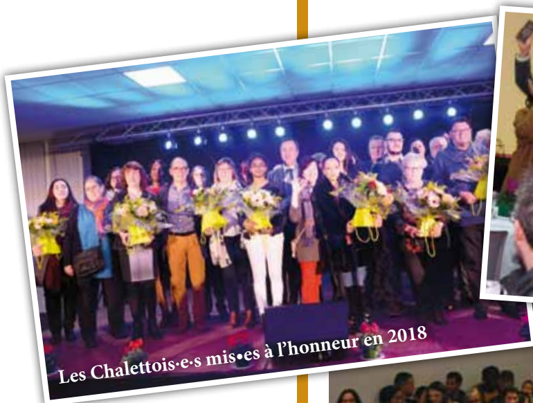
Les Chalettois·e·s mis·es à l'honneur en 2018

préambule de son intervention, laquelle s'est poursuivie par l'annonce de la mise en œuvre d'un Plan d'action pour l'amélioration du service public communal dont l'objectif est de faire évoluer la façon de travailler, tous ensemble, maire, élus, cadres et agents. Et le maire d'ajouter : « C'est la raison pour laquelle j'ai souhaité vous associer toutes et tous à la réflexion. Nous sommes volontaires, décidés et motivés pour continuer de faire avancer notre service public et, avec lui, toute notre ville, au service de ses habitants » . La soirée s'est poursuivie par la présentation des félicitations aux agents médaillés et retraités de l'année, et par le repas et la soirée dansante, le tout dans la convivialité, permettant à chacun d'échanger et de se retrouver dans un autre cadre que celui du travail.