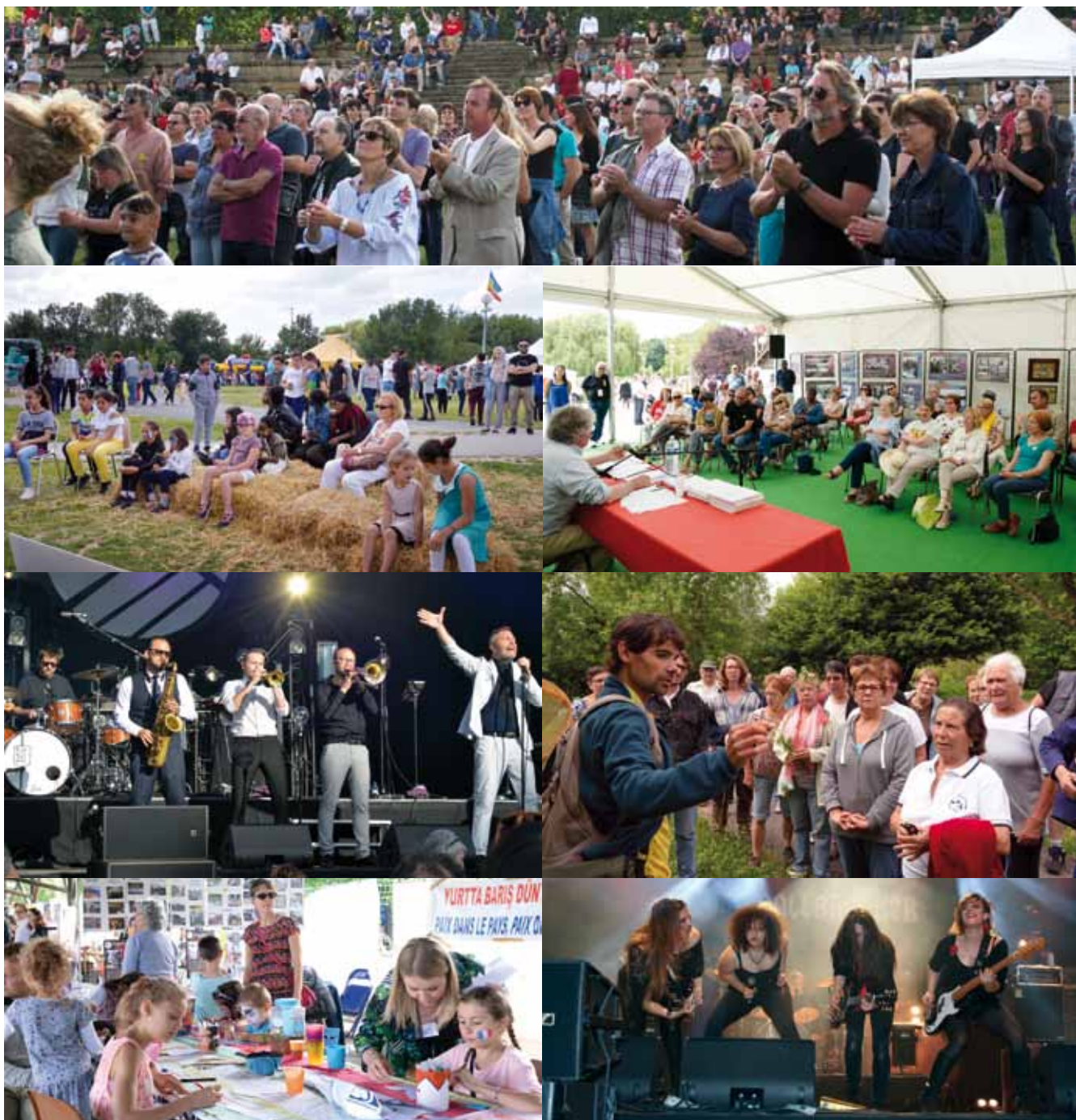
Album photos et vidéo disponibles sur la page Facebook et sur le site de la Ville

blic a pu réaliser un petit tour du monde en découvrant les problématiques de chacun des pays représentés et en dégustant les différentes spécialités culinaires. Deux jours pour découvrir les différentes associations de la ville, qu'elles soient sportives, culturelles, humanitaires et qui agissent tout le long de l'année pour contribuer au « faire et bien vivre ensemble » à Chalette. Deux journées ponctuées par des concerts exceptionnels des Ladies Ballesbreaker et Electro Deluxe qui ont embarqué le public dans une liesse généralisée. Un grand merci, donc, à tous les acteurs de cet événement, associations, services municipaux et Chalettois, qui ont permis une fois de plus le succès de cette traditionnelle fête.