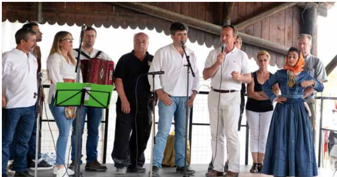
Le maire à la fête annuelle de l'association des Portugais du Gâtinais le 24 juin dernier

La Ville de Chalette organise, pour la deuxième année consécutive, « Chalette fait son (F)estival », avec tout un panel d'activités qui permet à tous les habitants - et notamment celles et ceux qui ne peuvent partir en vacances - de bénéficier de moments de plaisir initiés à la fois par les services municipaux mais aussi par les associations, les comités de quartier et les citoyens eux-mêmes.