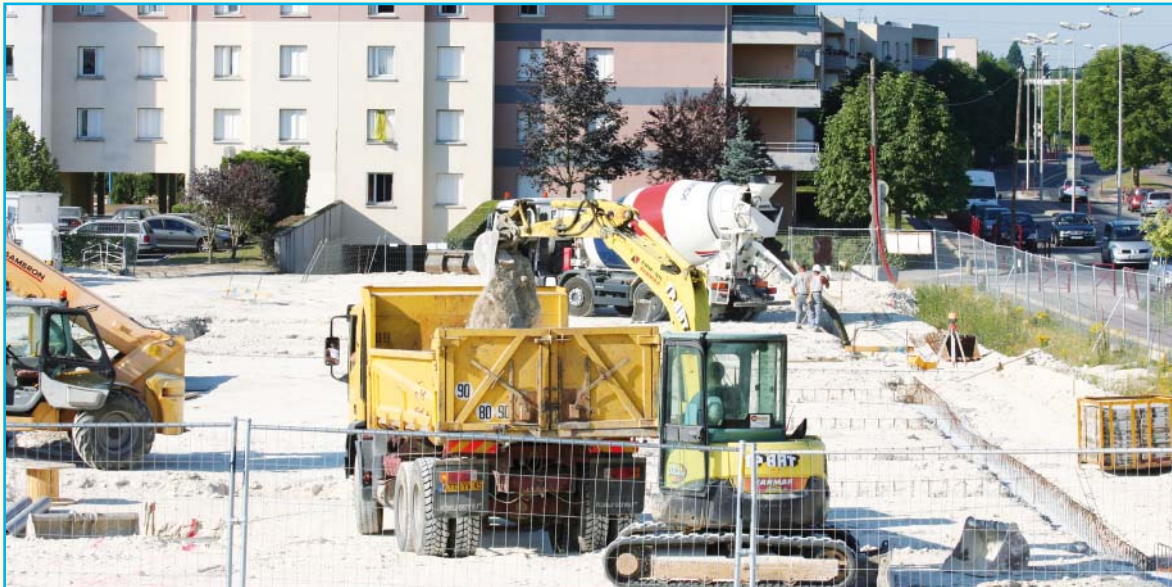
La ville en pleine mutation, pour preuve ici le quartier Kennedy Château-Blanc.

E lus locaux, militants associatifs, urbanistes, sociologues et intervenants sociaux, architectes, paysagistes, aménageurs et habitants... Tous, nous sommes les maillons essentiels pour construire la ville, la comprendre, la faire vivre, l'embellir, la dessiner... Tous, nous avons un jour partagé l'intuition que l'amélioration de notre cadre de vie pouvait être le point de départ d'un mieux être, collectif comme individuel. C'est une aventure humaine des plus passionnantes que celle de rechercher le plus grand dénominateur commun de ce qui fondera le développement d'un territoire à léguer aux générations futures. Entre les habitants et leurs représentants, ceux qui ont pour mission de gérer la cité, d'assurer la sécurité, la qualité de vie et l'égalité d'accès des citoyens aux services sanitaires et sociaux, quel travail en commun pour créer la ville de demain ?