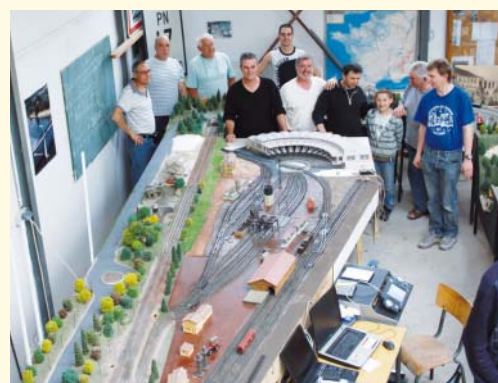
Initiative en faveur de la solidarité avec le peuple d'Haïti, en mai 2010 organisée par l'Association Gâtinaise des Amateurs de Trains (AGAT).

A Chalette l'aide aux associations se décline sous plusieurs formes. D'une part la ville apporte un soutien financier par l'allocation d'une subvention de fonctionnement ou exceptionnelle. D'autre part elle octroie à chaque association Chalettoise le prêt d'une salle et d'un transport en car gratuits une fois par an, la mise à disposition de matériel ou bien l'intervention des services municipaux dans certains cas. Enfin par le biais de ses publications municipales elle aide à la promotion des activités. Ces aides représentent un montant non négligeable auquel s'ajoutent les subventions. Par ces actions, la municipalité veut contribuer au maintien et au développe-