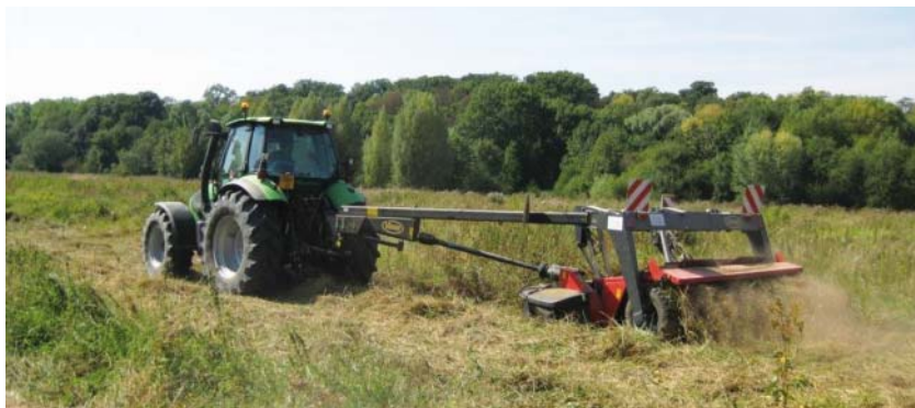
fauche 2009 au Grand Rozeau

Prés Blonds sont partielles : seule la moitié des parcelles est fauchée chaque année, de manière à ce que chaque zone ne subisse une intervention qu'une fois tous les deux ans, et qu'il existe toujours des zones refuges pour la faune dérangée pendant la fauche.