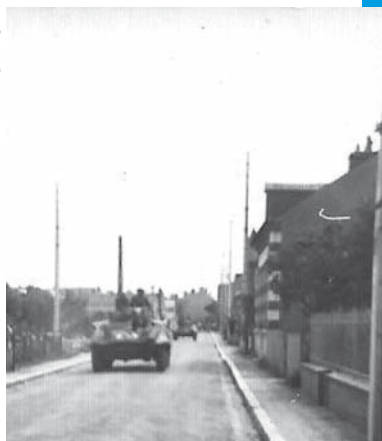
23 août 1944 : vers le 83 rue Gambetta