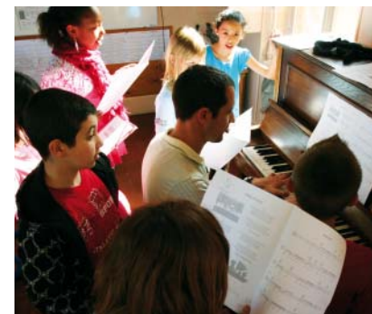
Activité chant lors la pause de midi.

Pour toute nouvelle inscription scolaire durant l'été, il convient de se présenter au service scolaire de la ville muni du livret de famille, d'un justificatif de domicile, du carnet de santé et en cas de changement d'école d'un certificat de radiation.