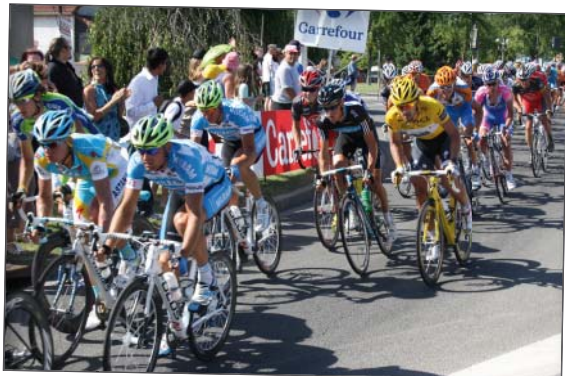
Le maillot jaune, ce jour-ci, Fabian Cancellera, à la sortie du rond-point Allende