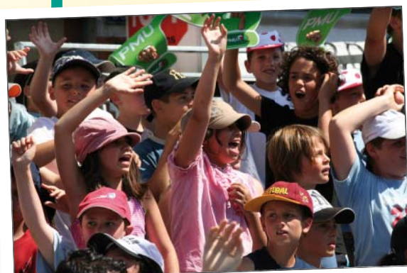
Les enfants des centres de loisirs saluent les coureurs