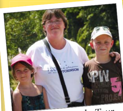
Avant le passage du Tour ... en famille