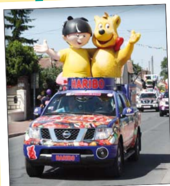
La caravane publicitaire dans Vésines