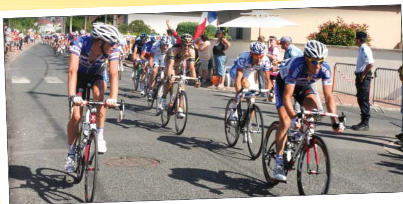
Passage du peloton rue des Vignes