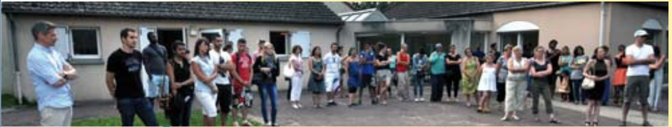
Plus de 150 personnes mobilisées pour un vrai été à Chalette

Arrêt sur images sur quelques activités du mois de Juillet.