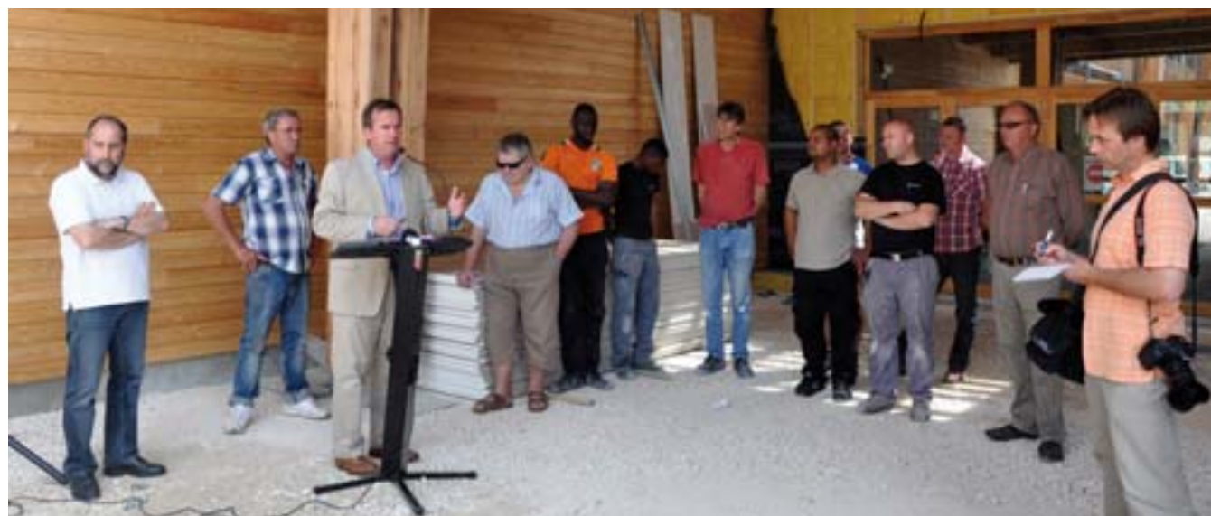
Le maire félicite les entrepreneurs pour leur engagement en direction des jeunes

Point Information Jeunesse (PIJ) Tél. 02 38 89 59 49