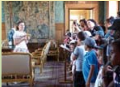
Visite du château de Thoiry