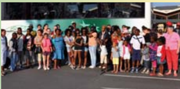
Départ en vacances à Oléron avec le C.C.A.S