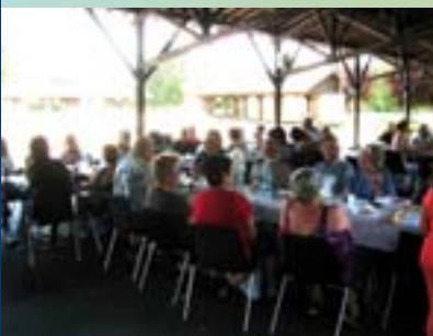
Pique-nique citoyen avec les comités de quartier