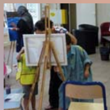
Atelier peinture organisé par le service enfance et famille