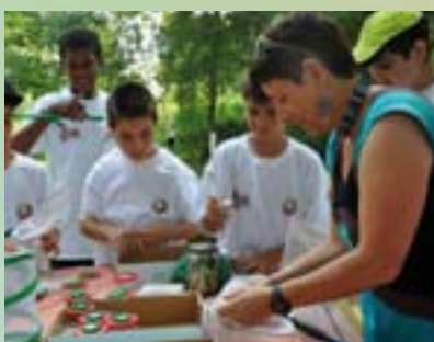
Initiation à la biodiversité près de la Maison de la Nature et de l'Eau