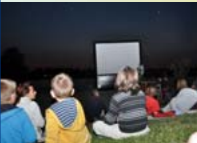
Séance ciné sous les étoiles