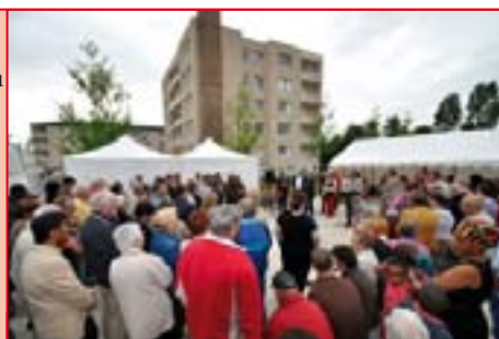
Inauguration des nouveaux aménagements rue Paul-Painlevé