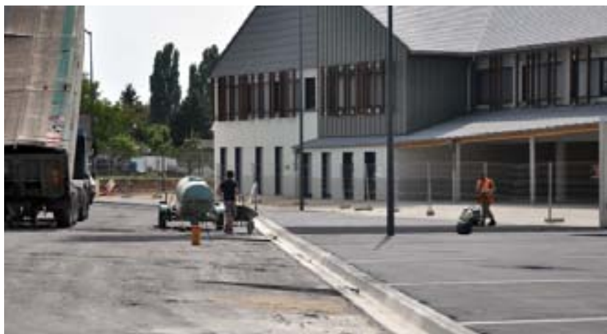
Parvis du collège Pablo-Picasso