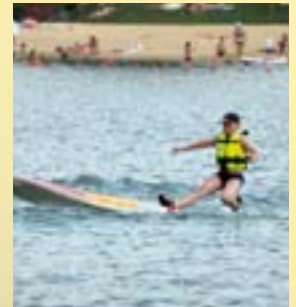
Initiation au Paddle