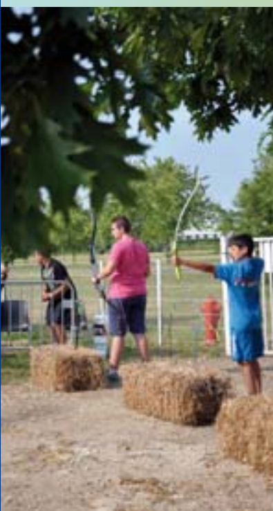
Initiation au tir à l'arc à la base de loisirs du lac avec le service des sports