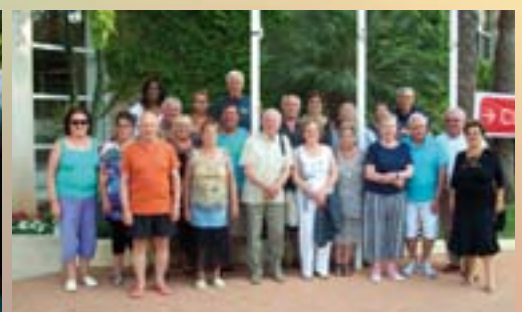
Séjour aux Baléares avec le SE.MU.RPA.