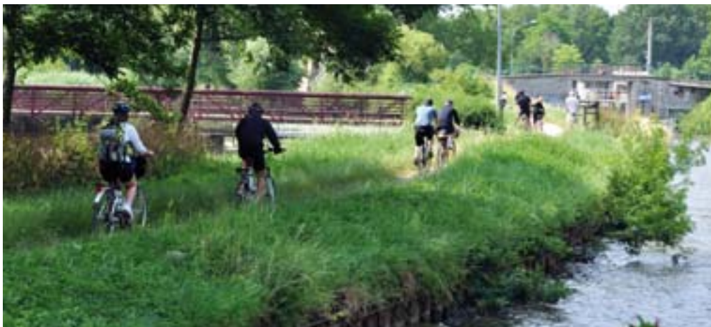
Le long du Canal du Loing