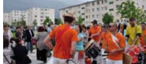
Inauguration en fanfare avec la Batucada chalettoise