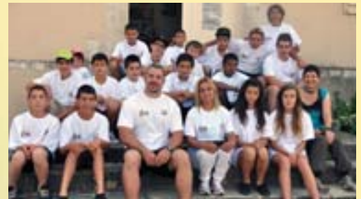
Opération « Zéro mégot à la plage » avec le club bouge ados