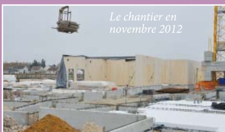
Le chantier en novembre 2012

Le succès était au rendez-vous ! Sous le soleil du samedi ou sous le ciel plus nuageux du dimanche, ce sont plusieurs milliers de personnes qui ont visité la fête. Placée sous l'égide de l'amitié entre les peuples, cette manifestation a été marquée par deux moments forts : les rencontres avec les délégations turque et palestinienne et le concert d'Idris qui a déplacé la foule des grands jours.