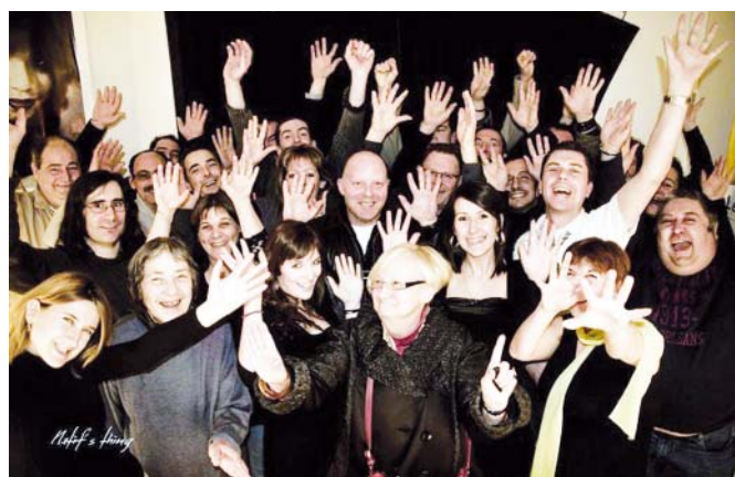
L'équipe des bénévoles radio.

La radio a développé aussi au fil des années l'aspect informatif (informations locales, départementales, régionales, nationales et internationales) par le biais de reportages sur