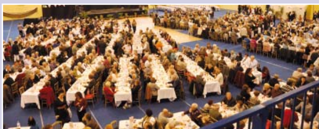
Dimanche 4 mars 900 retraités réunis pour un repas festif au complexe sportif du Château-Blanc