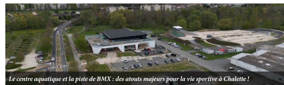
Le centre aquatique et la piste de BMX : des atouts majeurs pour la vie sportive à Chalette !