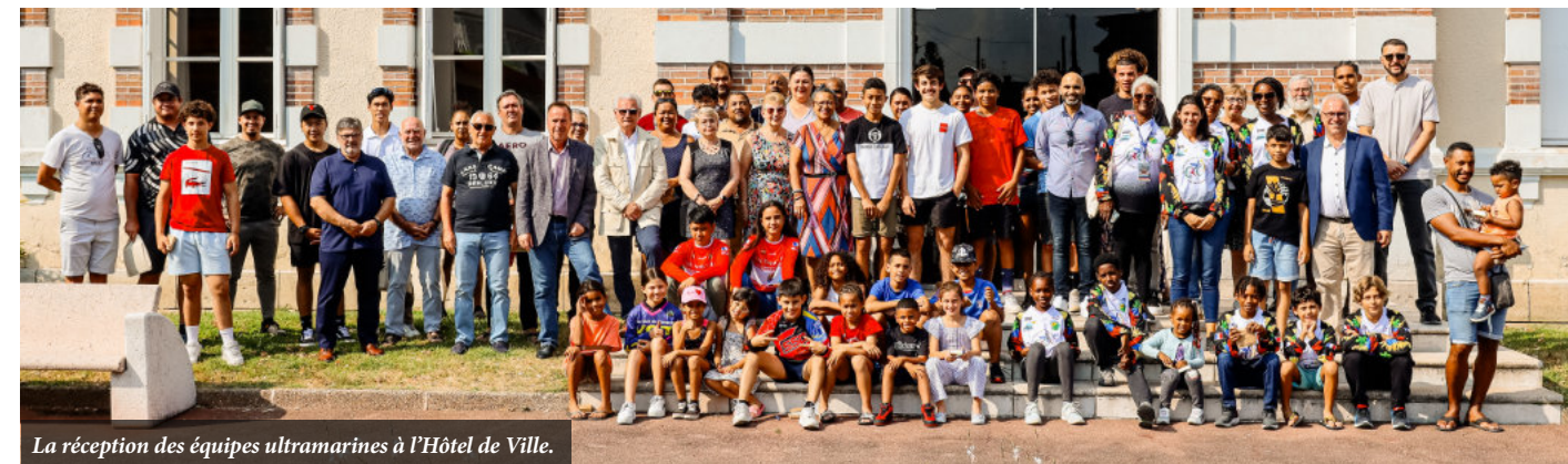
La réception des équipes ultramarines à l'Hôtel de Ville.