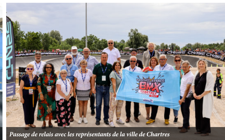
Passage de relais avec les représentants de la ville de Chartres