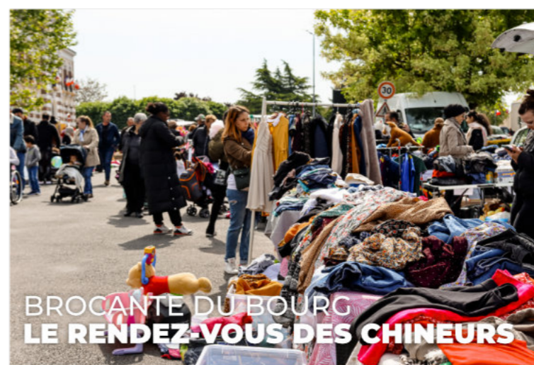
BROCANTE DU BOURG LE RENDEZ-VOUS DES CHINEURS