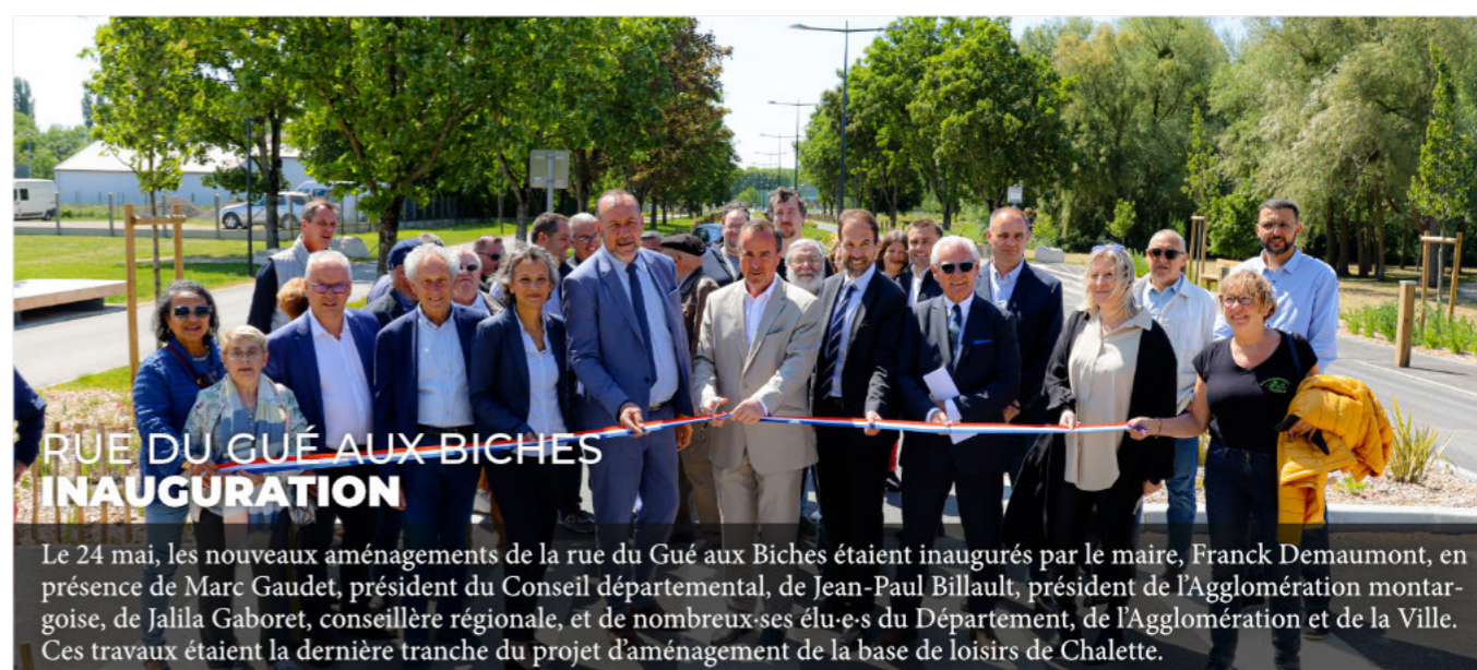
RUE DU GUÉ AUX BICHES INAUGURATION

Cérémonie du souvenir à Chalette en présence de François Bonneau, président de la Région Centre-Val de Loire.