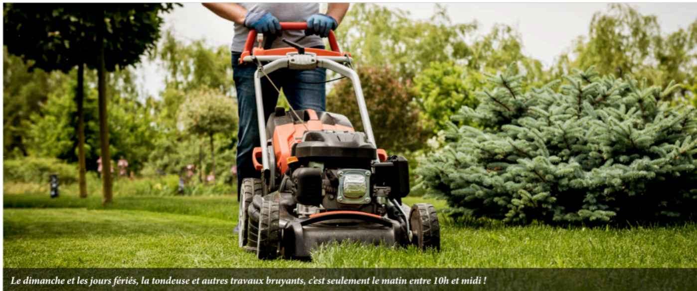
Le dimanche et les jours fériés, la tondeuse et autres travaux bruyants, c'est seulement le matin entre 10h et midi !

Dans tous les cas, la meilleure solution pour régler un problème de voisinage, c'est le dialogue !