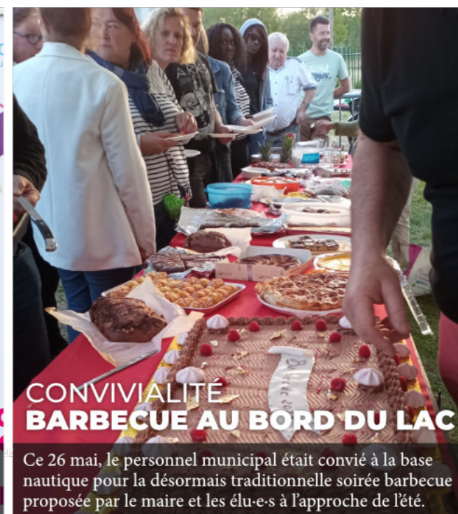
CONVIVIALITÉ BARBECUE AU BORD DU LAC

Premières rencontres dans les quartiers avec les élus de Chalette. Rendez-vous le 7 juin dans le Bourg, le 14 juin à Kennedy-Château-Blanc et le 30 juin à Vésines-La Folie.