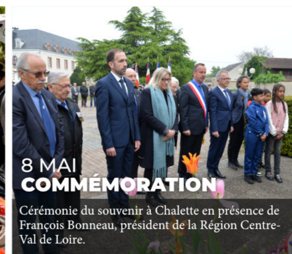
8 MAI COMMÉMORATION