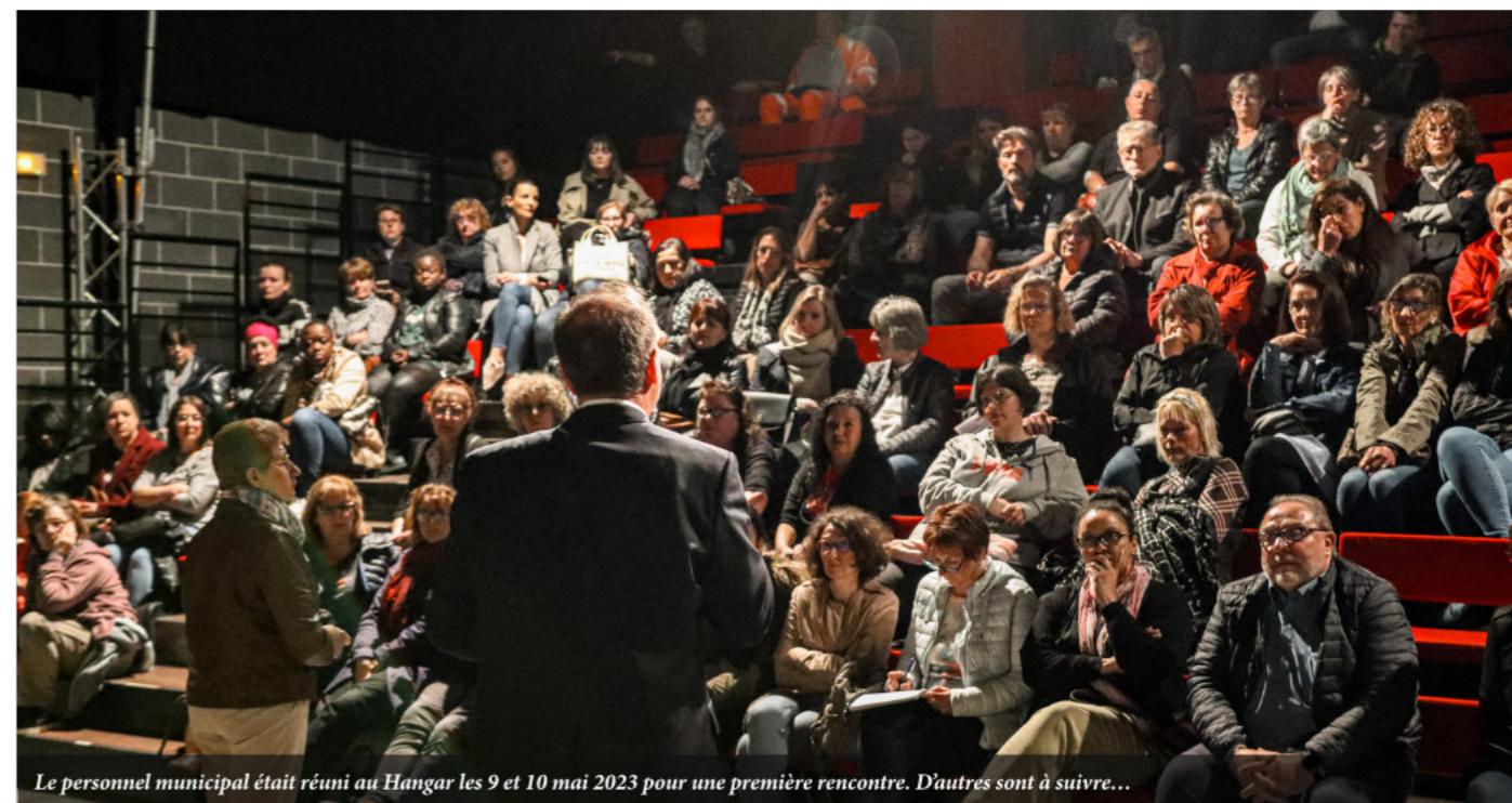
Le personnel municipal était réuni au Hangar les 9 et 10 mai 2023 pour une première rencontre. D'autres sont à suivre...

Un effort sensible des services pour travailler avec moins de moyens